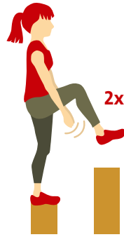
Mittel Bei jedem Schritt auf einem Bein stehen bleiben, anderes Bein anheben und zweimal unter dem Knie klatschen