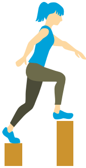
Leicht Vorwärts steigen